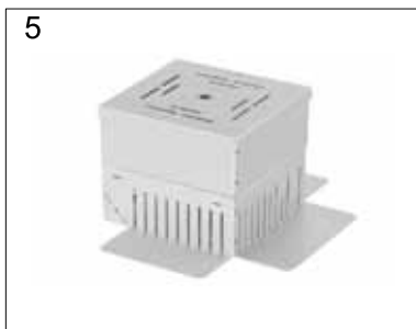
5 Auch mit Aufsatzschacht verwendbar