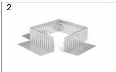
2 Schacht falten