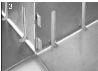
3 Stoß zusammenstecken