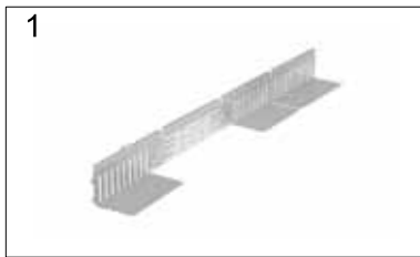
1 Kontrollschacht im Lieferzustand