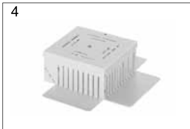
4 Schachtabdeckung aufsetzen

Laschen einfach in die Aufnahmeöffnung schieben und umlegen