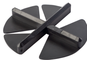
Fugenkreuz FG UFO für dünne Keramik- und Betonplatten (erhältlich in schwarz oder grau) Fugenbreiten: 3 / 5 mm

Für die Verlegung sind keine besonderen Werkzeuge notwendig.