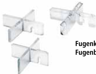
Fugenkreuz FGK transparent Fugenbreiten: 3 / 5 / 10 mm