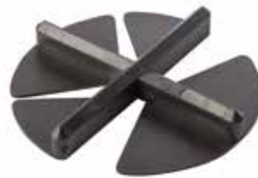
Fugenkreuz FGKU für dünne Keramik- und Betonplatten (erhältlich in schwarz oder grau)

Für die Verlegung sind keine besonderen Werkzeuge notwendig.